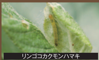
リンゴコカクモンハマキ